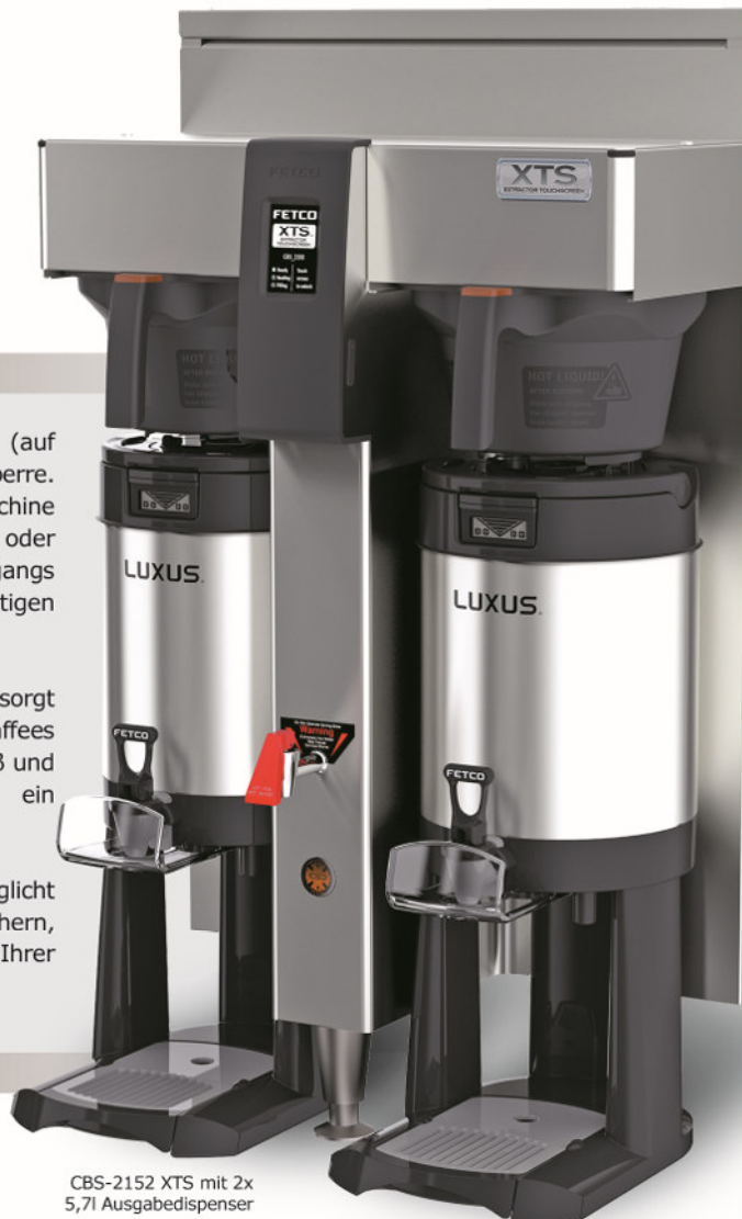
CBS-2152 XTS mit 2x 5,7l Ausgabedispenser